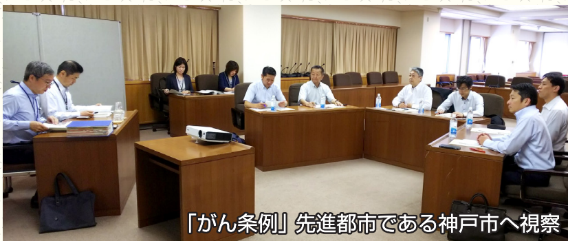
「がん条例」先進都市である神戸市へ視察

これまで一貫してがん対策を推し進めてきた公明党。静岡市におけるがん対策を更に強化するために、公明党静岡市議会の提案で静岡市議会7例目となる議員提案による政策条例「(仮称) 静岡市がん克服条例」の検討委員会設置が6月議会において全会一致で決定いたしました。2月議会での条例制定を目標に全力で取り組んでまいります。