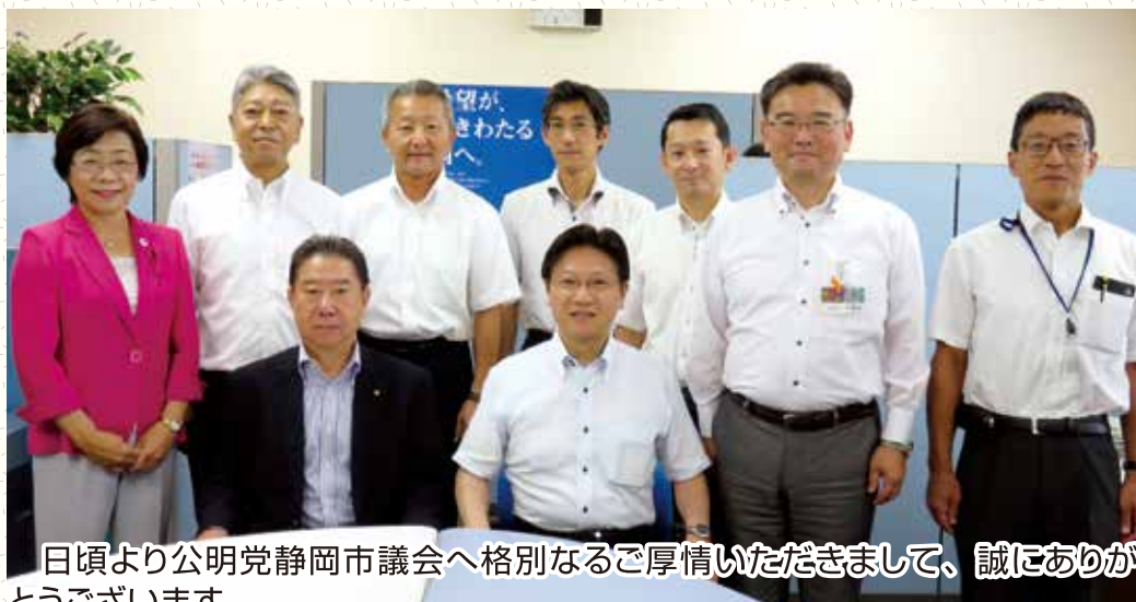
日頃より公明党静岡市議会へ格別なるご厚情いただきまして、誠にありがとうございます。

この度の参議院選挙において与党が議席を伸ばすことができ、安定した政治と経済成長への道が開かれ、地方創生への更なる加速が期待されます。本市における地域活性化、防災対策、子育て対策、高齢化社会への対応などの諸課題に対し政策の提言を行い、希望がゆきわたる静岡市のために全力を尽くして参る決意です。今後とも何卒よろしくお願い申し上げます。