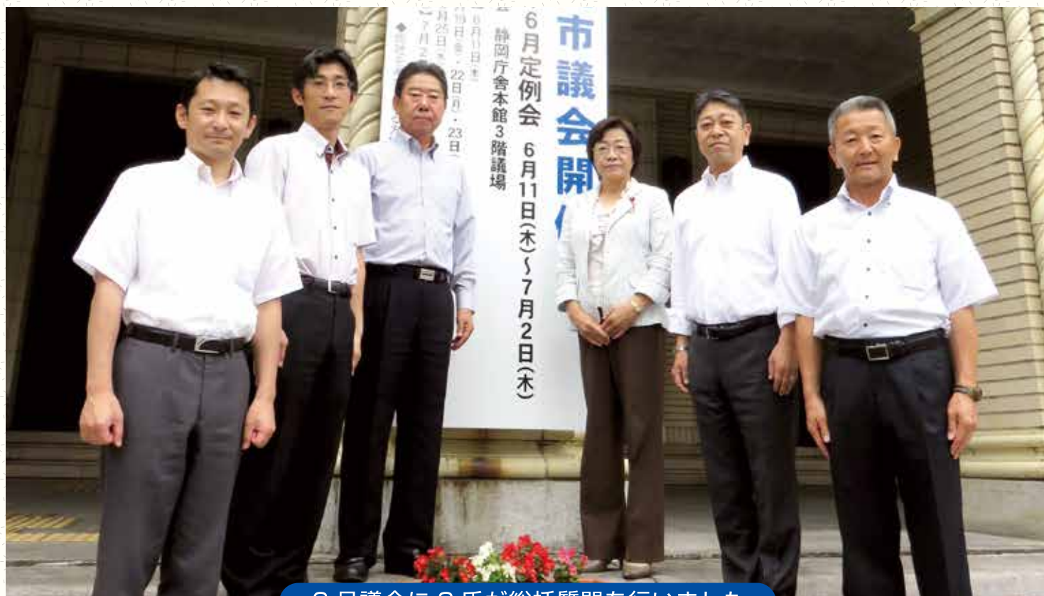
6月議会に3氏が総括質問を行いました